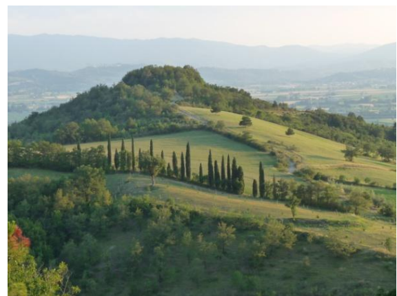
Wundervolle Umgebung für FitnessWalking.